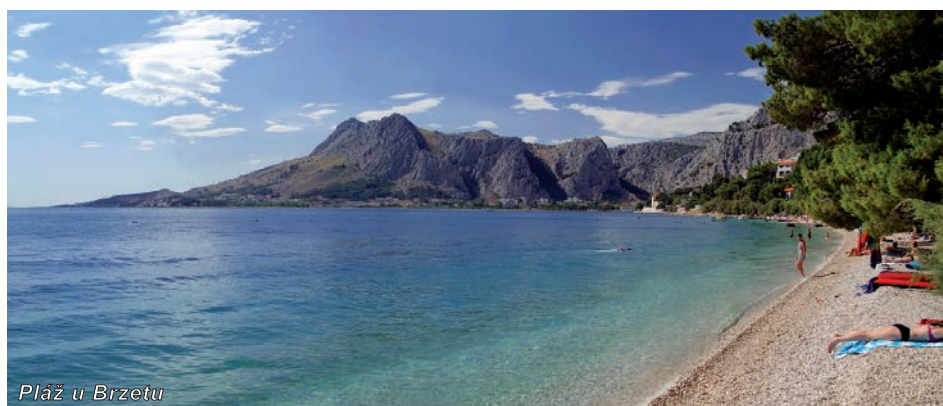
Pláž u Brzetu

Hotel Brzet je hotelem pavilonového typu, najdete ho ve stejnojmenné části Omiše na klidném a tichém místě a hlavně v těsné blízkosti moře. Obklopen je borovicovým lesíkem, jehož stáří je více jak 100 roků. Hotel se skládá ze 3 ubytovacích pavilonů, součástí je centrální recepce, centrální restaurace s terasou a kavárnou, na recepci je k dispozici Wi-Fi, parkování je zajištěno na vlastním hotelovém parkovišti . Jedná se o moderní a oblíbený hotel především mezi českou klientelou. Je vhodný pro pobyt rodin s dětmi i starších klientů. Vybavením i kvalitou služeb jistě uspokojí i náročné klienty a to za rozumnou cenu.