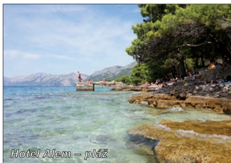
Hotel Alem – pláž

Letovisko Baško Polje se nachází na Makarské riviéře, 2 km jihovýchodně od velkého populárního letoviska Baška Voda, 8 km severozápadně od Makarské. Vyniká krásnými plážemi z drobných oblázků, bohatstvím okolních borových lesů a jedinečnou přírodní scénérií, již dominuje vápencový hřeben pohorí Biokovo. Podél pobřeží vede promenádní cesta pro pěší, po které se lze dostat do všech okolních středisek, např. do Bašky Vody to je cca 20 minut pěšky krásnou procházkou po pobřeží.