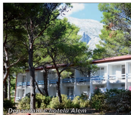
Depandance hotelu Alem