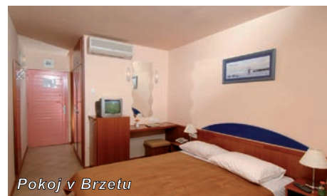
Pokoj v Brzetu