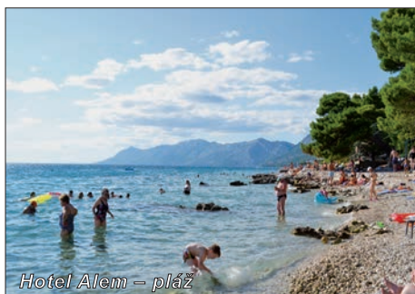
Hotel Alem – pláž