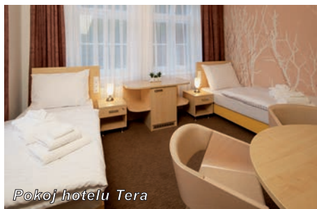
Pokoj hotelu Tera