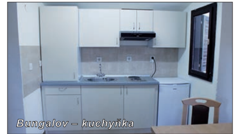
Bungalov – kuchyňka