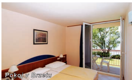
Pokoj v Brzetu

slevy pro děti 2 – 10 let: 1 dítě se 2 dospělými osobami na pokoji -50% (sleva již odečtena v ceniku) 1 dospělá os. s 1 dítětem nebo 2 samotné děti na pokoji – dítě vždy -30% (sleva již odečtena v ceniku) sleva 3. dospělá os. na pokoji – 20% (sleva již odečtena v ceniku)