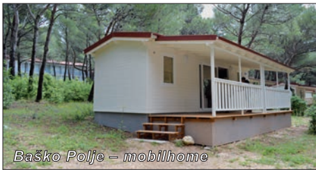
Baško Polje – mobilhome