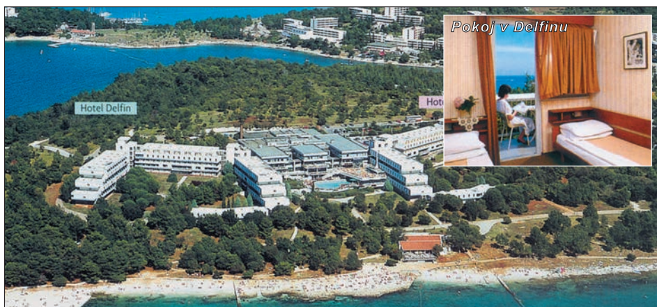
Pokoj v Delfinu

Jednolůžkové pokoje a 1/4 family pokoje na vyžádání.