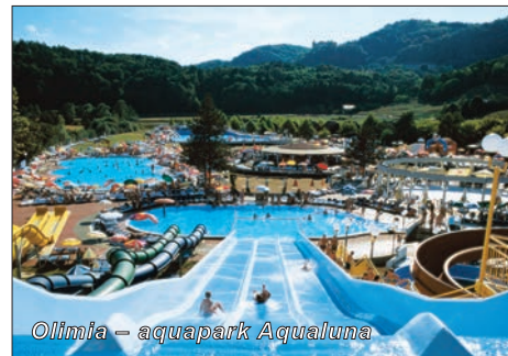
Olimia – aquapark Aqualuna

Podrobnou nabídku na Terme Olimia včetně ceníků najdete na www.erikatour.cz a www.erika-zajezdy.cz