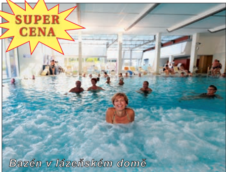
Bazén v lázeňském domě