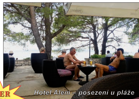
Hotel Alem – posezení u pláže