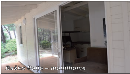
Baško Polje – mobilhome