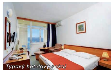
Typový hotelový pokoj