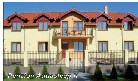
Penzion Aquasleep II