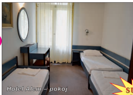
Hotel Alem – pokoj

NAŠE HODNOCENÍ: starší hotel s jednoduchým ubytováním, starší nábytek, v krásném prostředí, zábava na dosah. Výborná bohatá strava – švédské stoly a nápoje k večeři.