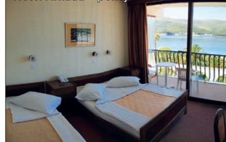
Hotel Arkada – pokoj