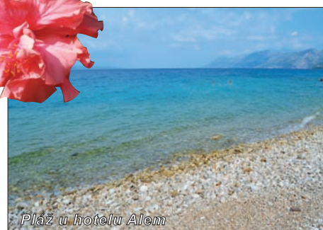
Pláž u hotelu Alem