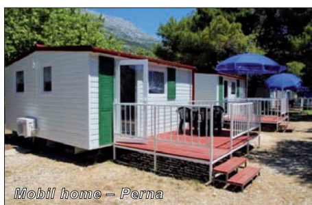
Mobil home – Perna

Vybavení: klimatizace, 2x dvoulůžková ložnice, denní místnost s rozkládací pohovkou (1 přistýlka pro dítě do 10 let), WC, sprcha, stůl, židle. Možnost příkoupení polopenze v hotelu Komodor.