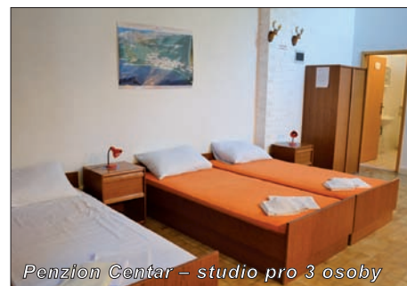
Penzion Centar – studio pro 3 osoby