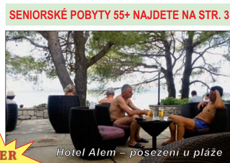
Hotel Alem – posezení u pláže