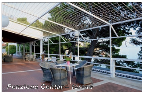
Penzione Centar – terasa

Všechny apartmány mohou používat velkou terasu obrácenou směrem k pláži i menší terasu v zadním traktu.