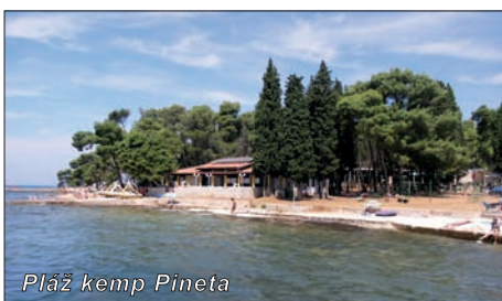
Pláž kemp Pineta

Původně byl Medulin zemědělským a rybářským městečkem. Medulin najdeme cca 10 kilometrů jižním směrem od Puly (spojení do Puly je místní hromadnou dopravou). V dnešní době však patří Medulin mezi vyhledávaná střediska istrijského pobřeží. Leží téměř v nejnižší části Istriie v rozlehlém a mělkém Medulinském zálivu. Zajímavostí je, že dno zálivu je písčité. V okolí Medulinu se loví langusty, které naleznete také na jídelních lístcích místních restaurací. Rekreační v letovisku vyhledávají především rodiny s dětmi, kteří ocení dobré přírodní podmínky a klidnou dovolenou oproti velkým střediskům Chorvatska (Pula, Poreč apod.). Pláže jsou šterkopiskové s velmi pozvolným vstupem do moře. Medulin patří po sportovní stránce k těm nejlepším střediskům na Istrii. Naleznete zde velké sportovní vyžití počínaje vodními sporty (škola windsurfingu, sportovní rybolov, škola potápění, jachting, vodní lyže atd.) a konče míčovými hrami (volejbal, fotbal, tenis apod.). Naleznete zde také upravenou trať pro přespolní běh. Za zmínku stojí půjčovna motorových i obyčejných člunů a jízdních kol. Cyklisty potěší cyklostezka na poloostrově Kamenjak. Velmi oblíbené jsou výlety na Brižuni – jedno z nejkrásnějších soustroví Jadrana.