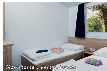
Mobilhome v kempu Pineta

MOBILHOME VANGA PREMIUM – celková rozloha 32m 2 (8 X 4 m), počet lůžek : 4 základní + 2 přistýlky, 2 ložnice, kuchyň a obývací prostor, 2 koupelny, dřevěná krytá terasa 4 x 2,5 m, parkovací místo