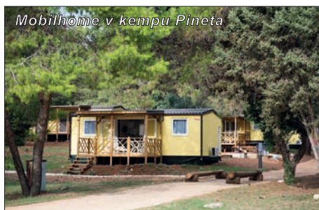
Mobilhome v kempu Pineta