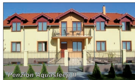
Penzion Aquasleep II