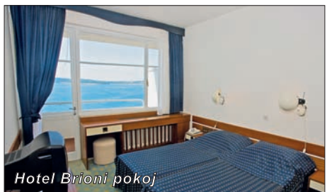
Hotel Brioni pokoj

Pula je největší a nejstarší město Istriie s tisíciletou minulostí. Ještě do dnešní doby se zachovaly budovy starých Římanů – Vítězný oblouk Sergijavac, Augustův chrám a především Koloseum, nádherně zachovalý amfiteátr z 1. století našeho letopočtu. Pula je nejenom kulturní, hospodářské a dopravní centrum (mezinárodní letiště, železnice, osobní i nákladní přístav), ale i důležité turistické centrum. Na lesnatém poloostrově a ostrovech kolem města byla vybudována kvalitní turistická střediska. Na slunečném a zeleném poloostrově asi 3,5 km vzdáleném od středu města, je vystavěno středisko Punta Verudela, či nedaleko Puly, asi 10 km západně podél pobřeží, na jedné z nejkrásnějších částí Istriie, leží rybářská a turistická oblast Medulin.