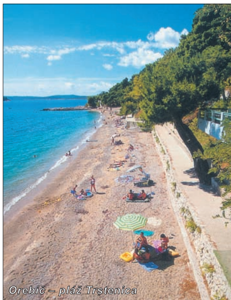
Orebič – pláž Trštenica

Městečko Orebič se nachází na poloostrově Pelješac, který svou přírodní krásou přitahuje řady turistů. Středem poloostrova se vypíná pohoří dosahující až 700 m nadmořské výšky a porostlé lesy a macchií. Svěží větrík láká milovníky windsurfingu a příhodné proudění zajišťuje křišťálovou čistotu zdejšího moře. Orebič je nejdůležitější středisko na jižním pobřeží poloostrova. Dostanete se sem buď z Trpanje přes hřeben Pelješace (cca 20 km) nebo bez použití trajektu jízdu přes celý poloostrov. Čeká vás zde dovolená v příjemném prostředí uprostřed subtropické zeleně s koupáním v průzračném moři. Nesmíte zapomenout ochutnat místní vynikající vína a můžete nahlédnout do bohaté námořní historie zdejší oblasti, vždyť Korčula Marca Pola je na dohled.