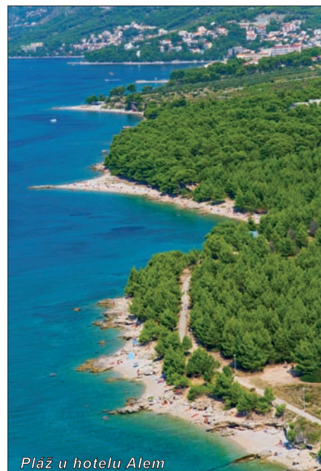
Pláž u hotelu Alem