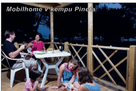
Mobilhome v kempu Pineta

Kemp Pineta je situován blízko moře (250 m) a má nádherný výhled na Fažanský záliv a souostroví Brižunských ostrovů. Pineta je vzdálena pouze desetiminutovou procházkou po pobřeží od Fažany a 8 km od historického města Pula. Kemping Pineta má dobré sportovní zázemí: volejbal, basketbal, stolní tenis a minigolf. V kempu je restaurace s příjemnou terasou ve stínu, restaurace nabízí rybí a masové speciality. Dále je zde obchod se zeleninou, novinový stánek a pekařství.