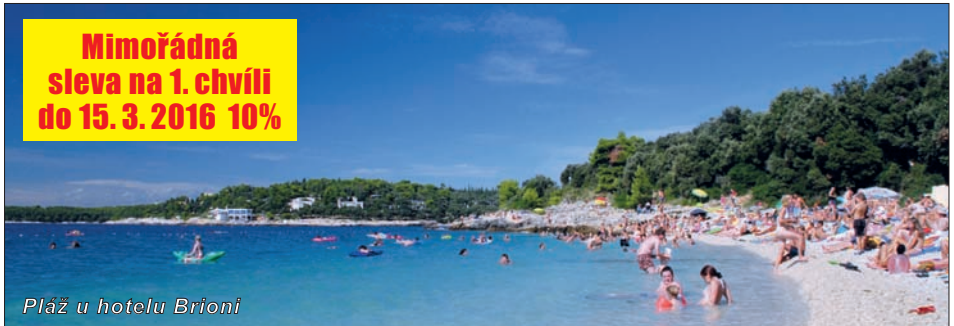
Pláž u hotelu Brioni