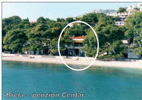
Brela – penzion Centar

Brela patří k nejoblíbenějším a nejproslulejším chorvatským střediskům, jehož pláže byly mimo jiné ohodnoceny modrou vlajkou. Má několik částí. My vám nabízíme ubytování v centrální části Soline, která nabízí veškeré služby: směnárny, restaurace, pizzerie, bary, občůdky a možnosti sportování a zábavy. Nic z toho však neubírá letovisku na intimní eleganci. Pláže z droboučkových oblázků lemují vonící pinie, jejichž větve sahají téměř k moři a poskytují tak příjemný stín. Kouzelnou pobřežní promenádou lze dojít do romantických zátok s výtečnými hospůdkami nebo do rušnějšího letoviska Baška Voda.