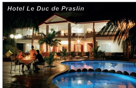
Hotel Le Duc de Praslin

CENY OD: 56.490 Kč (10denní zájezd – 7x nocleh se snídaní, letenka s přestupem včetně let. tax, transfery do hotelu a zpět)