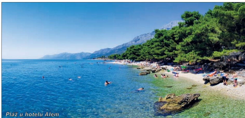
Pláž u hotelu Alem

Slevy: 1. dítě do 12 let zdarma 2. dítě do 12 let BEZ lůžka s 2 dospělými a 1 dítětem 50% (sleva již odečtena v ceníku) dospělá osoba s 2 dosp. – 3. lůžko 20% (sleva již odečtena v ceníku)