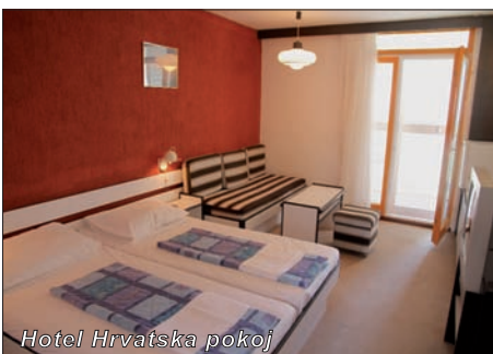
Hotel Hrvatska pokoj

Vyžití: Za poplatek: v blízkosti tenisové kurty, hřiště na minifotbal, volejbal, nohejbal, minigolf, široká nabídka vodních a plážových sportů. V hotelu se v sezóně pořádají animační pořady (ve slovenštině).