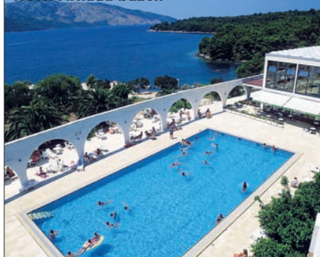
Hotel Arkada bazén

Stari Grad je staré rybářské městečko, které založili Řekové již ve 4. stol. př. n. l. a zachovalo si množství památek, které jsou svědky bohaté historie z řecké a římské doby. Stari Grad leží v hlubokém Starigradském zálivu, chráněný před studenými větry. Zajímavou stavbou mimo jiné je vila básníka Hektoroviče Tvrdalji z počátku 16. století. Turistické středisko má skalnaté pláže, umělá kamenná pláž i menší písčité pláže. V blízkém okolí je oblíbená zátoka Plava Laguna s výhledem na Bol na ostrově Brač. Stari Grad má dobré trajektové spojení jak se Splitem, tak i s Vela Lukou na Korčule, s ostrovem Vis, ostrovem Lastovo a Dubrovnikem.