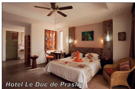
Hotel Le Duc de Praslin

Hotel prošel nedávno zásadní rekonstrukcí všech svých zařízení a získal dvanáct zcela nových pokojů. Nyní je pokládán za nejlepší čtyř* hotel na ostrově Praslin.