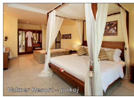
Valmer Resort - pokoj