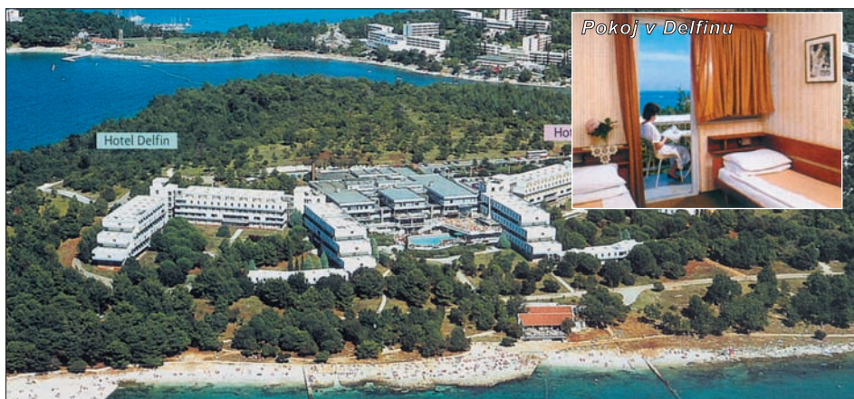
Pokoj v Delfinu

Jednolůžkové pokoje a 1/4 family pokoje na vyžádání.