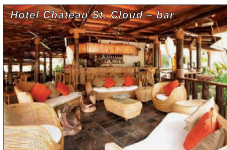
Hotel Chateau St. Cloud - bar

Pokoje jsou každý jiný v koloniálním stylu. Některé se nacházejí v původní koloniální budově z roku 1929, další jsou rozesety ve svahu nad bazénem. Autentický vkusný nábytek dýchá rodinou atmosférou. Tři Standard pokoje jsou vybaveny ventilátorem, moskytiérou na vyžádání, sprchou, ledničkou, varnou konvicí, mini barem, televizí, terasou nebo