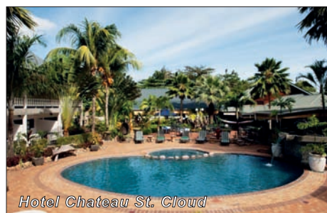
Hotel Chateau St. Cloud

CENY OD: 65.200 Kč (10denní zájezd – 7x nocleh se snídaní, letenka s přestupem včetně let. tax, transfery)