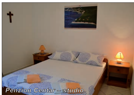
Penzion Centar – studio