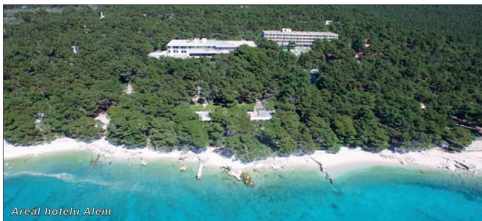
Areál hotelu Alem