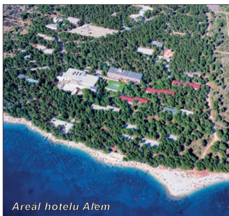
Areál hotelu Alem