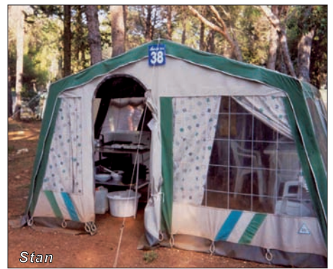
Ve spolupráci s partnerskou CK.