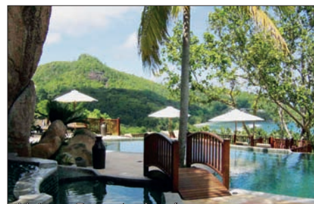
Valmer Resort - bazén

CENY OD: 64.900 Kč (10denní zájezd – 7x nocleh se snídaní, letenka s přestupem včetně let. tax, transfery do hotelu a zpět)