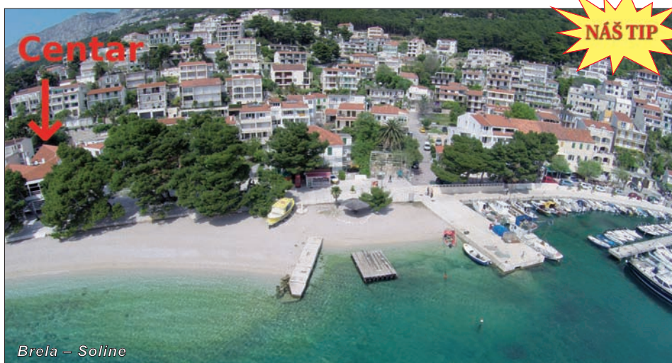
Brela – Soline