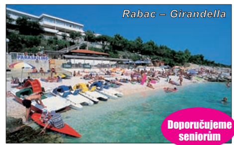
Rabac – Girandella

Pláže: dlouhé, oblázkové s pozvolným vstupem do moře, přírodní kamenité a skalnaté, vzdálené 50 – 100 m. Lehátka a slunečníky jsou k dispozici za poplatek.